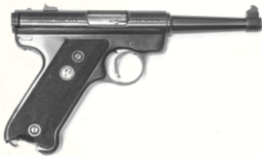
Ruger MK II (.22 LR)

Classique du tir sportif, le Ruger MK II est un pistolet semi-automatique élégant, précis, durable, et extrêmement économique à l'usage. Robuste, précis, facile à entretenir, peu coûteux.