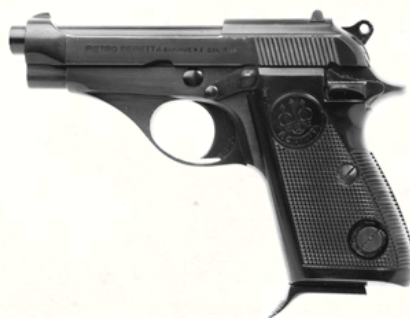
Beretta 70 (.32 ACP)

Version plus ancienne du Beretta 71, un peu plus lourde mais toujours élégante et facile à porter. Compact, stylé, fiable pour un calibre modeste.