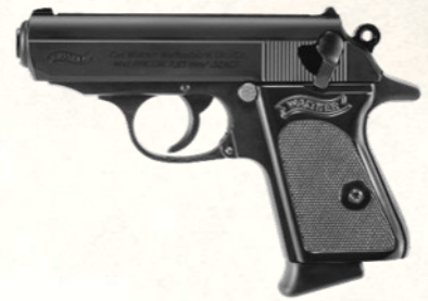
Walther PPK (.32 ACP)

L'arme favorite des espions de fiction et des véritables agents, célèbre pour son élégance compacte. Glamour mais modeste en puissance. Icône du cinéma d'espionnage.