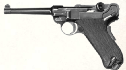
Luger 1900/1906 (.30 Luger)

La version suisse du fameux Luger, dotée d'une mécanique de précision et chamberée dans un calibre rapide et fin. Précis, technique, mécanique noble mais capricieuse.