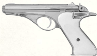
Whitney Wolverine (.22 LR)

Ce pistolet au design rétro-futuriste des années 50 ressemble à un accessoire de film de science-fiction. Rare, mais tout à fait fonctionnel. Étrange mais élégant, sujet de discussion autant qu'arme de tir.