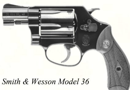
Smith & Wesson Model 36

Revolver compact (canon de 2"), 5 coups, dit "Chief's Special". Petit, fiable, facile à dissimuler.