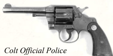
Colt Official Police

Revolver à canon de 4 à 6 pouces, 6 coups, robuste. "Solide comme un tank", dépassé mais fiable.