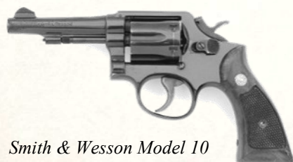
Smith & Wesson Model 10

Revolver standard, canon de 4 pouces, 6 coups. "Le revolver américain", basique mais mythique.