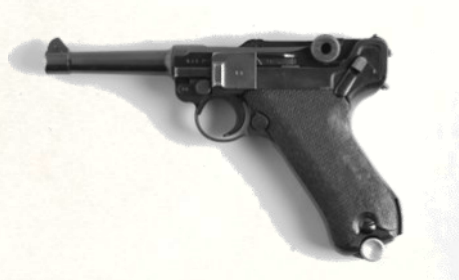
Luger P08 (9 mm Parabellum)

Symbole de la Première Guerre mondiale, ce pistolet allemand à genouillère attire les collectionneurs. Mythe armurier, élégant mais sensible à la saleté.