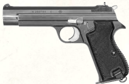
SIG P210-1 (.30 Luger)