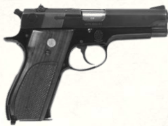
Smith & Wesson Model 39 (9 mm Parabellum)

Premier pistolet DA/SA américain, élégant et ergonomique mais dépassé par la concurrence double-stack. Innovant mais perfectible.