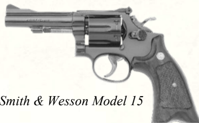
Smith & Wesson Model 15

Version améliorée du Model 10, avec organes de visée réglables. Précis et raffiné.