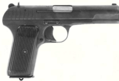
Tokarev TT-33 (7.62×25mm Tokarev)

Pistolet soviétique simple, puissant, à la balistique perforante. Son look brut dissimule une efficacité certaine. Rustique, fiable, percussion forte, mais sécurité quasi inexistante.