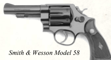
Smith & Wesson Model 58

Revolver massif, 6 coups, destiné à la police mais peu adopté. Trop puissant pour les services, trop discret pour les civils.