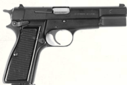
Browning Hi-Power (9 mm Parabellum)

Prix : 800 à 1000 $ et plus selon le calibre.