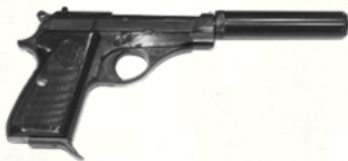
Beretta 71 (.22 LR)

Petit pistolet italien léger, fiable et remarquablement précis, le Beretta 71 est une arme à silencieux préférée des opérations clandestines. Ultra fiable et d'une discrétion redoutable avec modérateur de son.