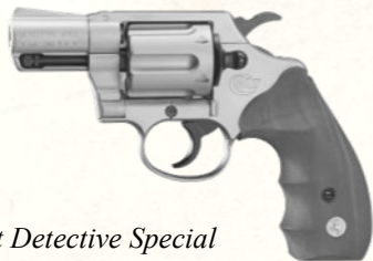
Colt Detective Special

Revolver compact à canon court (2 pouces), 6 coups. "L'arme de poche par excellence", discret mais efficace.