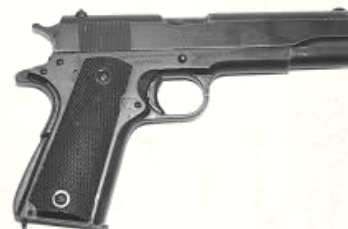
Colt M1911A1 (.45 ACP)

Icône de l'armement américain, lourd, fiable, simple, et encore largement utilisé. Puissance brute, silhouette légendaire, un classique éternel.