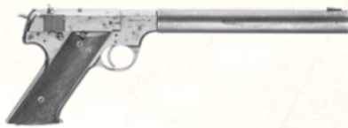
High Standard HDM (.22 LR)

Pistolet compact avec silencieux intégré, utilisé dans des opérations spéciales dès la Seconde Guerre mondiale. L'un des pistolets les plus silencieux jamais produits.