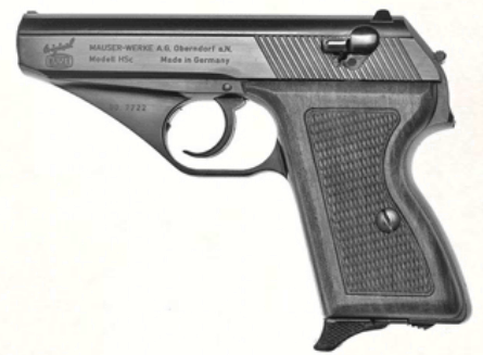
Mauser HSc (.32 ACP)

Petit pistolet allemand à la finition léchée, très populaire auprès des policiers d'après-guerre. Élégant, fiable, mais un peu daté.