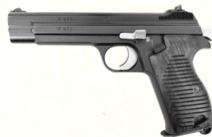
SIG P210-1 (9 mm Parabellum)

Même base que la version .30 Luger, mais en calibre moderne. Encore plus polyvalente. Sobriété suisse, précision redoutable, fiabilité exemplaire.