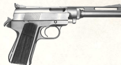
Wilby (gros calibres – .44 Auto Mag, .475 Wilby Magnum...)

Arme culte, c'est un monstre semi-auto conçu pour la chasse au gros gibier. Surpuissant, tape-à-l'œil, peu pratique au quotidien.