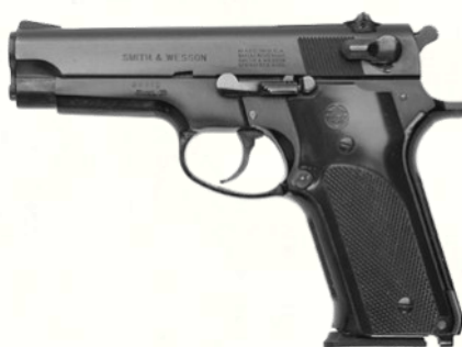
Smith & Wesson Model 59 (9 mm Parabellum)

La réponse américaine au besoin de chargeur haute capacité. Plus massif que le Model 39. Bonne capacité (14 coups), un peu large en main.