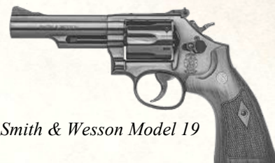
Smith & Wesson Model 19

Prix : 400–500 $ (voire plus selon finition)