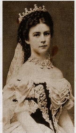
Élisabeth Amélie Eugénie de Wittelsbach, duchesse en Bavière puis, par son mariage, impératrice d'Autriche et reine de Hongrie